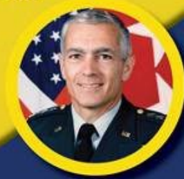
General (Ret.) Wesley Clark

This is a FREE event on Zoom thanks to the support of UKRFCU.